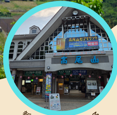
新しい挑戦ができる

仲間と楽しく学び、宿泊体験ができるイベントがついに実現！学習はもちろん、自然の中だからこそできるさまざまな体験プログラムに取り組みます。「普段と違う環境で学びを深めたい」「新しい体験にチャレンジしたい」「夏の特別な楽しい思い出を作りたい」「最後までやり抜き、自信をつけたい」というお子さまにおすすめです。この夏の最高の思い出を一緒に作りましょう！