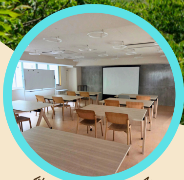
仲間と一緒に学ぶ