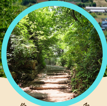
自然体験を楽しむ