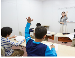
自分の気持ちや考えを言葉で伝えよう！