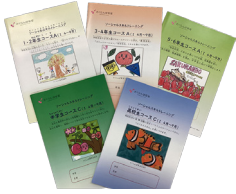
完全オリジナルSST教材

一人ひとりに合わせた学習とSSTを「友だちと一緒に」楽しく学ぶクラスです。小集団でコミュニケーション・社会性を培います。